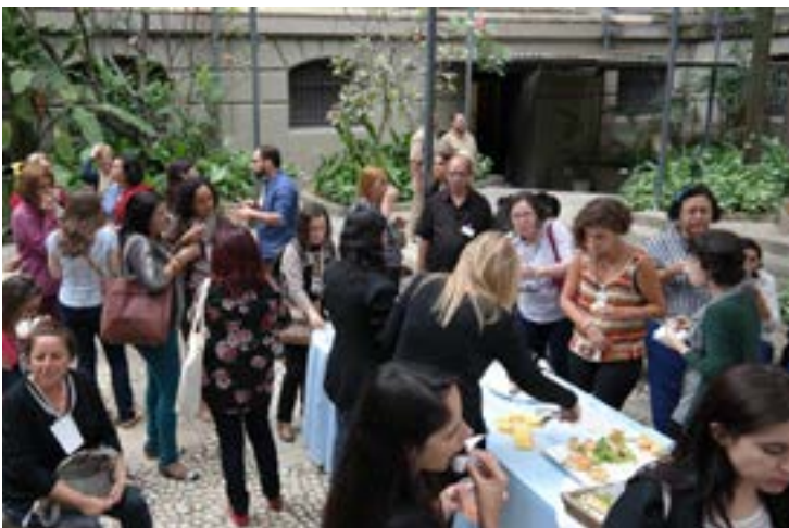
Participantes da Oficina