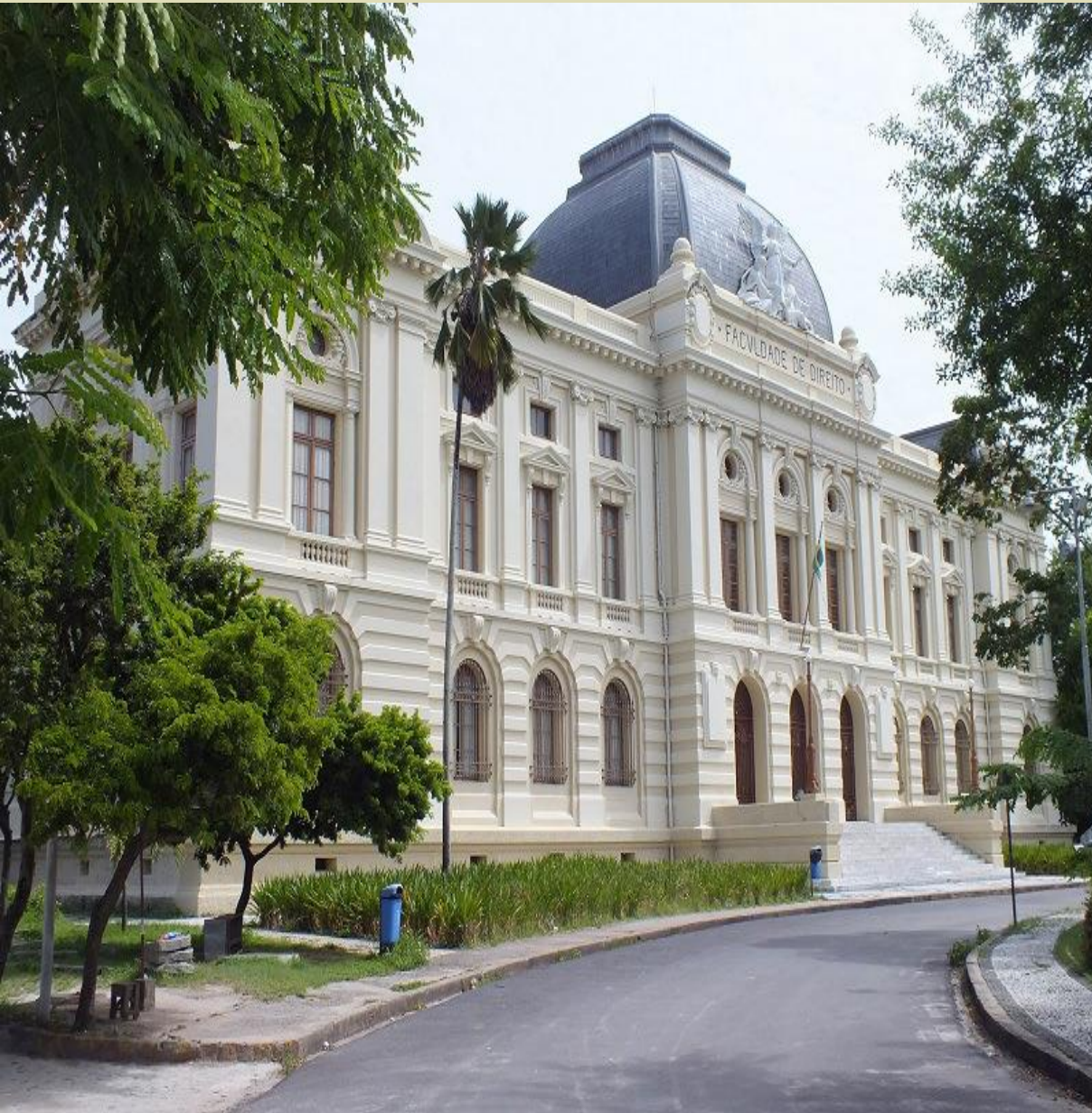
Imagen 2 - Facultad de Derecho de Recife (parte exterior)