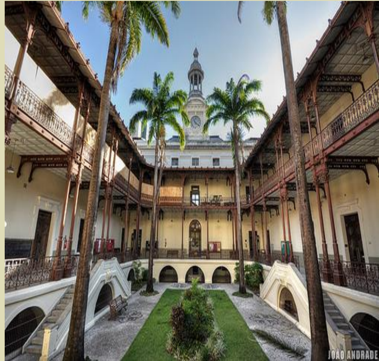
Imagen 3 - Facultad de Derecho de Recife (parte interior)