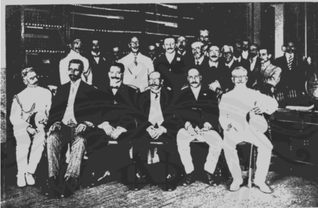
O sr. Marechal Hermes e o sr. dr Rivadavia Correia, ministro da Instrucção, depois de visitarem o Internato, são photographados com os lentes na sala da congregação